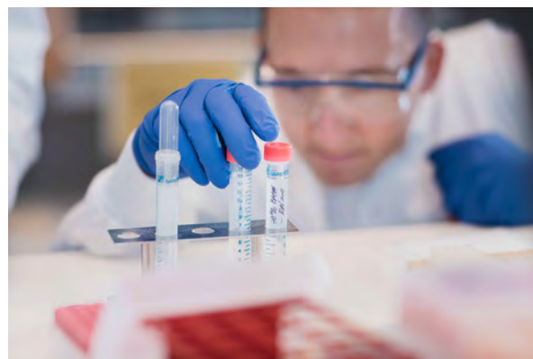
Мы нацелены на инновации в науке

Компания «АстраЗенека», базирующаяся в Кембридже (Великобритания), представлена более чем в 100 странах мира, а ее инновационные препараты используют миллионы пациентов во всем мире.