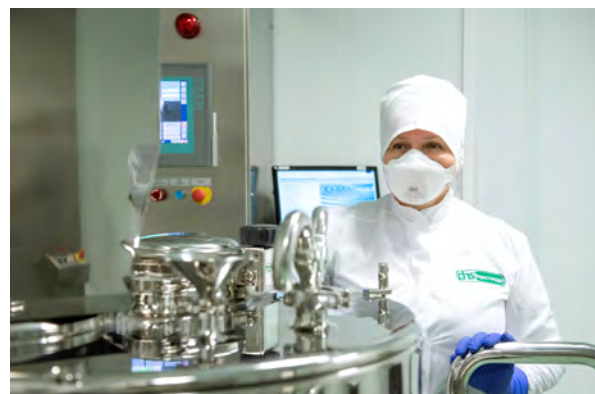
Наши усилия направлены на обеспечение потребности пациентов в качественной лекарственной терапии, а главная цель – сделать ее доступной.