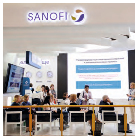
Будучи надёжным партнёром в области здравоохранения, Санофи тесно сотрудничает с медицинским сообществом

125009, г. Москва ул. Тверская, дом 22, БЦ «Саммит» +7 (495) 721-14-00 www.sanofi.ru