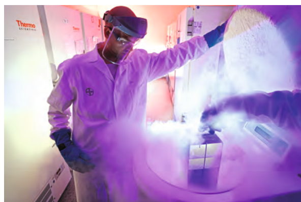
В приоритете наших разработок: кардиология, онкология, офтальмология и женское здоровье