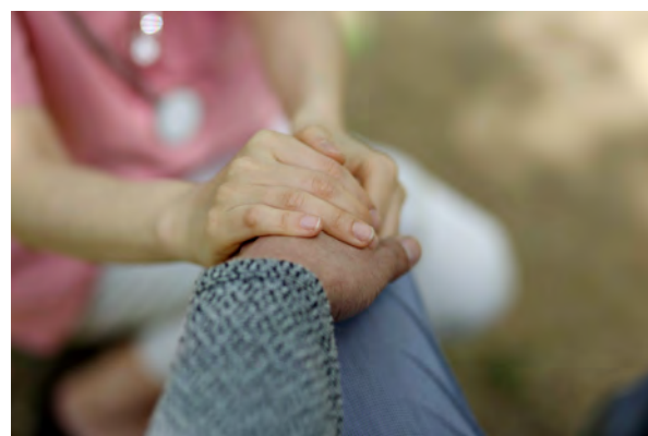
Помогаем формировать правильный подход к заболеванию.