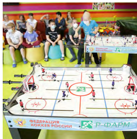
Хоккей против рака. Онкоцентр. Москва.