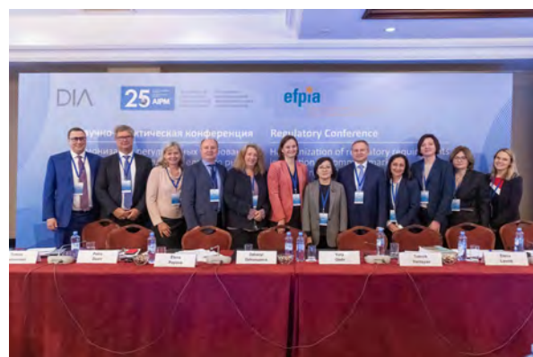
Международная научно-практическая конференция DIA-AIPM-EFPIA - "Гармонизация регуляторных требований при создании единого рынка лекарственных средств – опыт ЕАЭС и ЕС", 22.10.2019