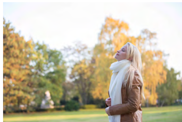
Открываем возможности для пациентов.