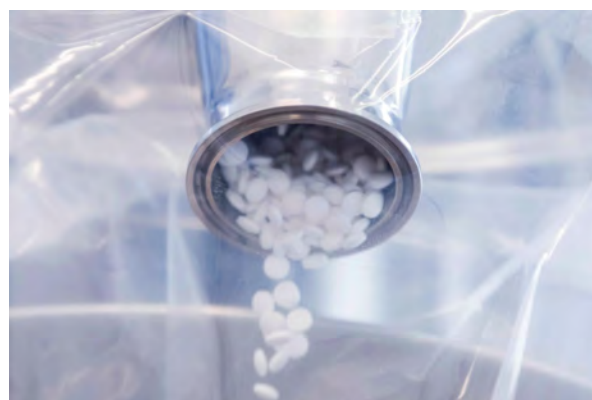
Миллионы пациентов применяют наши инновационные препараты