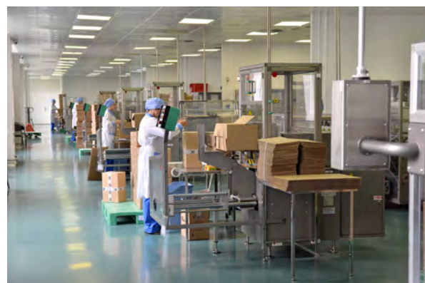
Фармстандарт эффективно применяет надлежащие практики на всех стадиях жизненного цикла препарата от разработки до поставки потребителю.