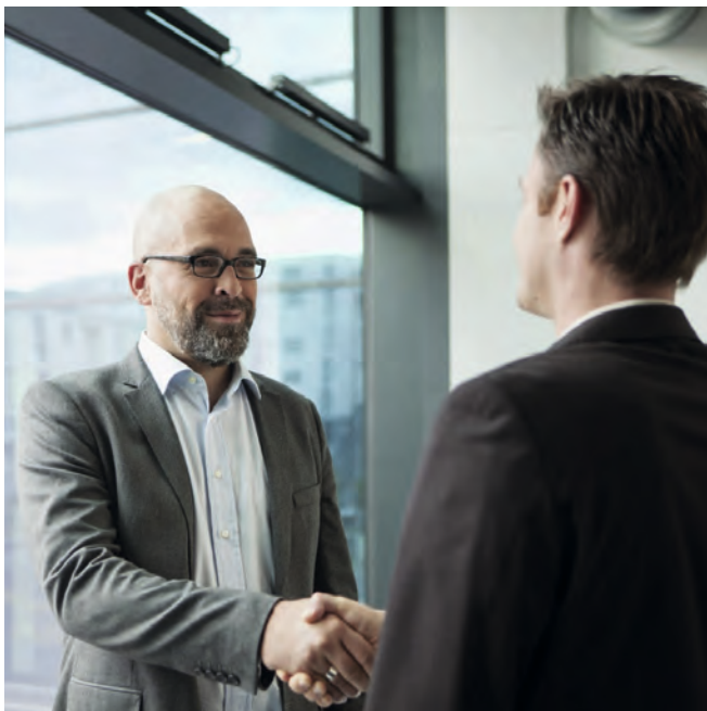
В партнерстве со всем миром