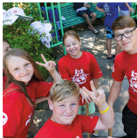
Санофи реализует социальные программы, направленные на повышение осведомлённости о заболеваниях и улучшение качества жизни пациентов