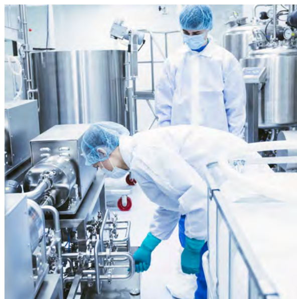
Производственный комплекс BIOCAD