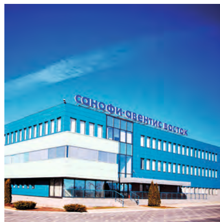
Завод «Санофи-Авентис Восток» в Орловской области производит новейшие инновационные препараты

Будучи надёжным партнёром государства в области здравоохранения, Санофи в тесном сотрудничестве с медицинским сообществом и пациентскими организациями проводит всероссийские эпидемиологические исследования и реализует различные социальные программы, направленные на повышение осведомлённости о заболеваниях и улучшение качества жизни пациентов.