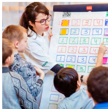
Воспитанники детского дома. Ржев.