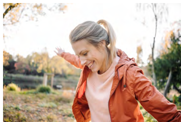
Teva выбрала инновационный путь развития.