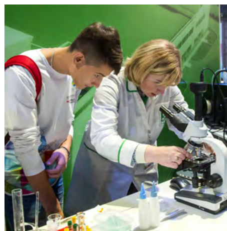
Образовательные проекты. Ярославль.