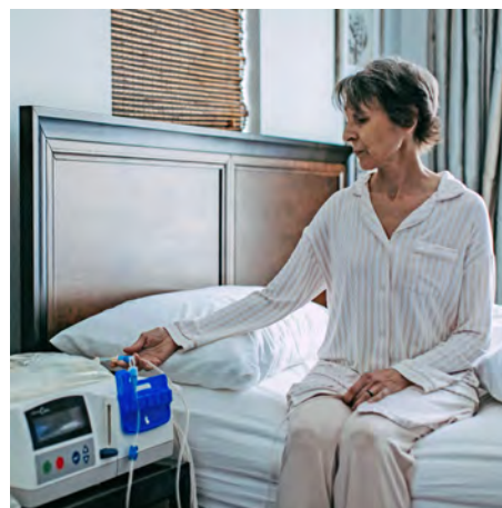
Забота о пациенте