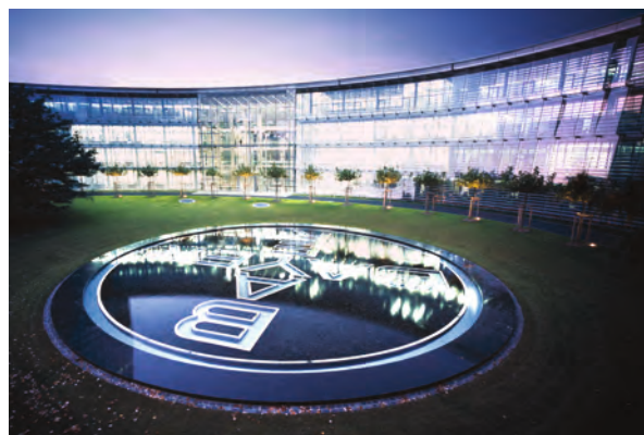
Социальная ответственность – неотъемлемая часть миссии Bayer

107113, Москва 3-я Рыбинская ул., д. 18, стр. 2 +7 (495) 231-12-00 www.bayer.ru