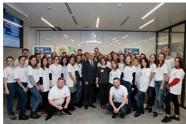
«День AIPM» на IX Фармацевтическом Лагере инноваций «ФИЛИН-2019»