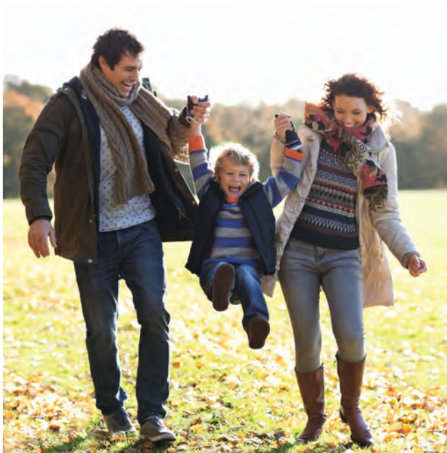
На благо здоровья каждого