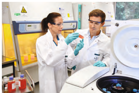
Исследования компании направлены на поиск инновационных молекул