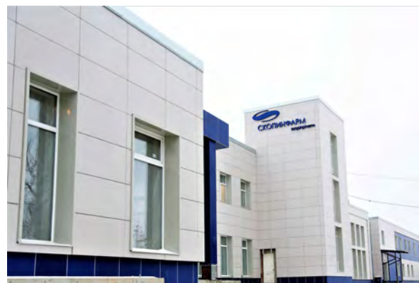
Скопинский фармацевтический завод - изначально спроектирован и построен с учётом требований GMP.