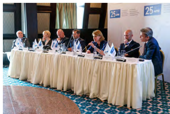
Пресс-брифинг AIPM в рамках 25 Российского фармацевтического форума – 2019, Санкт-Петербург