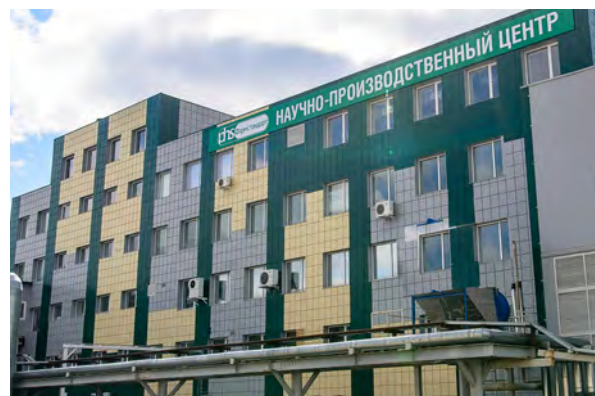
Фармстандарт сегодня – это производственные предприятия, сертифицированные по стандартам GMP/ISO.

141700, Московская область г. Долгопрудный, Лихачевский проезд, дом 5 Б +7 (495) 970-00-30, ф. +7 (495) 970-00-32 https://pharmstd.ru/