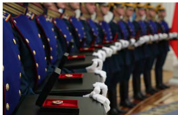
Награждение Государственной премией в области науки и технологий за 2019 год