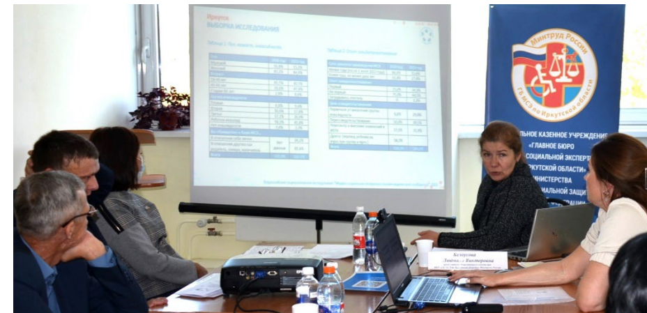
14.09.2023г. Заседание ОС.

Одним из вопросов в повестке заседания «Обзор результатов исследования»